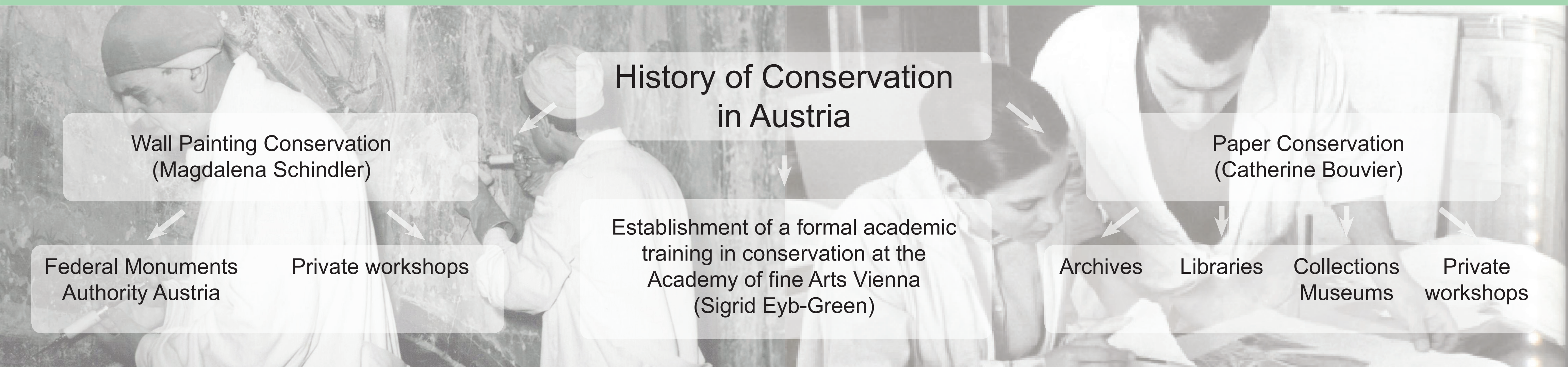
1964, conservation of the romanesque wallpaintings in Lambach, Upper Austria.